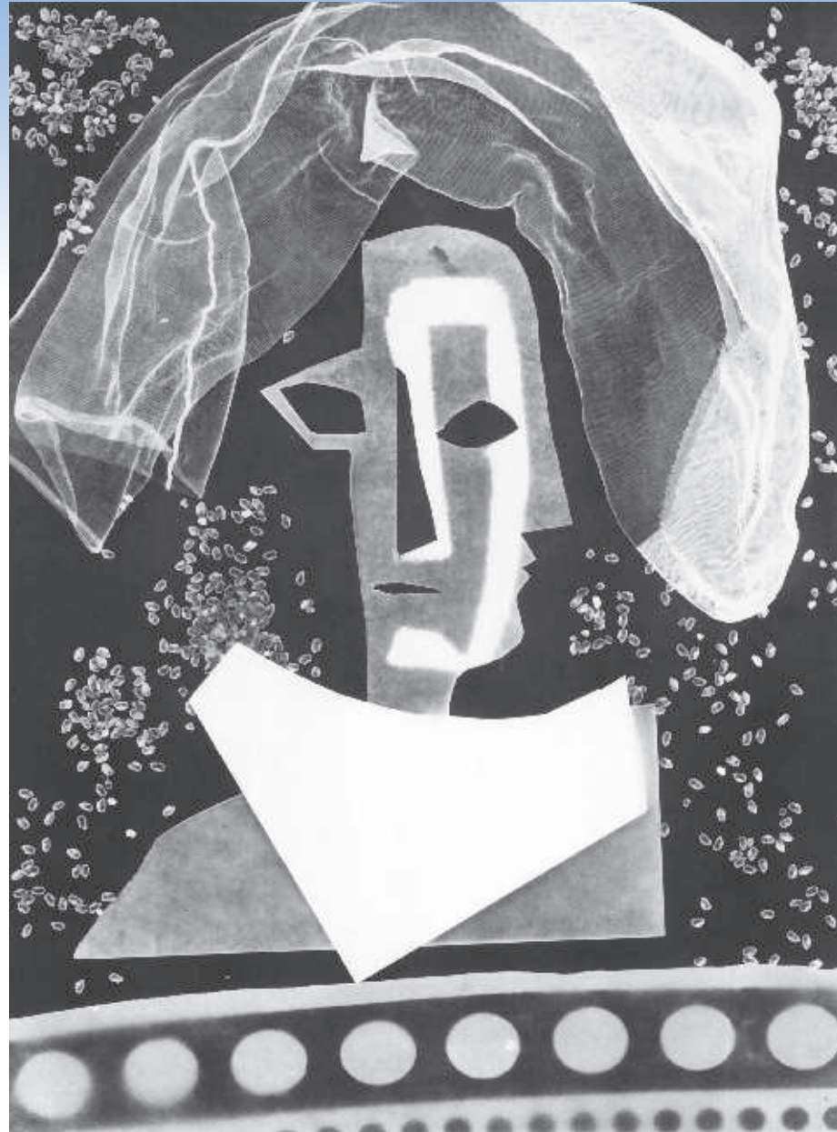
Pablo Picasso/Dames, Dames. La malle comme elle est. 1961 © Succession Picasso 2018 © André Villers, ADOP 2018