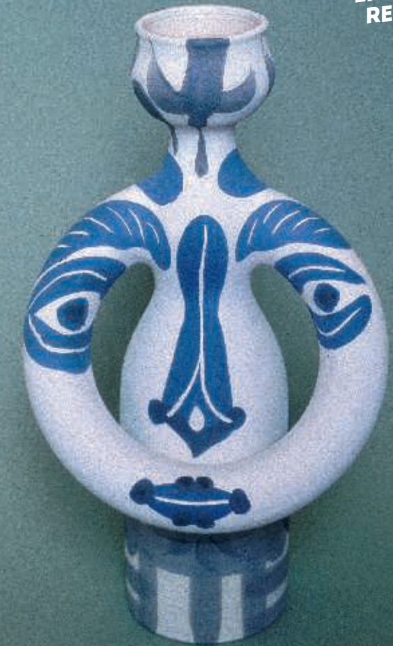
Pablo Picasso, Vase lampé femme, 1955. Céramique. Réplique authentique, terre de faïence blanche, décor aux engobes, gravé au rouleau, 35 x 19,50 cm. Musée Magnelli, musée de la céramique, Vallauris © succession Picasso, 2018

VALLAURIS / MOUGINS / MOUANS-SARTOUX 6-7-8 JUILLET 2018 EXPOSITIONS RENCONTRES VISITES