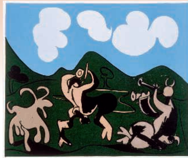
Pablo Picasso. Femmes et chèvres 4, estampe. 1953, musée national Picasso - Paris