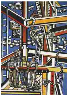
Les Constructeurs, 1950

« J'ai voulu rendre cela : le contraste entre l'homme et ses inventions, entre l'ouvrier et toute cette architecture métallique, ce fer, ces ferrailles, ces boulons, ces rivets. » Léger