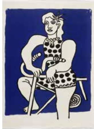
Fernand Léger, Cirque , 1950, Paris, Éditions Verve, lithographie, planche extraite d'un album illustré de 63 lithographies en couleurs et en noir et blanc, 42 x 64 cm, Musée national Fernand Léger, Biot © GrandPalaisRmn / Gérard Blot © Adagp, Paris, 2024

Au-delà de certaines affinités thématiques ou formelles, un lien historique existe entre l'œuvre de Fernand Léger et le Nouveau Réalisme. Fervent admirateur de son œuvre, Pierre Restany aurait ainsi baptisé le groupe en hommage à Léger, qui utilise cette formule dès les années 1920 pour définir sa démarche artistique. Par ailleurs, Fernand Léger et les artistes de cette génération ont en commun d'avoir renouvelé la création artistique en se réappropriant le monde réel et en portant souvent un regard critique et politique sur la société de leur temps.