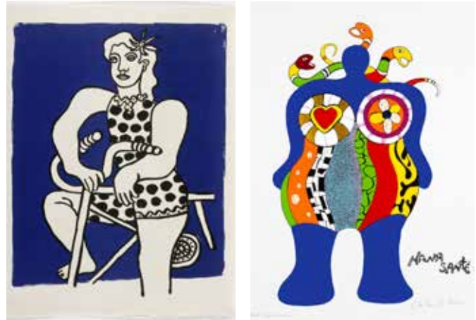
Fernand Léger, Circus , 1950, Paris, Éditions Verve, lithograph, plate from an illustrated album of 63 lithographs in colour and black and white, 42 x 64 cm, Musée national Fernand Léger, Biot © GrandPalaisRmn / Gérard Blot © Adagp, Paris, 2024

Continuing on from the exhibitions organised by the musée national Fernand Léger exploring the artist's collaborations or his posterity, the exhibition Léger and the New Realists highlights Léger's visionary modernity while demonstrating the possible sources of inspiration of these revolutionary 1960s artists.