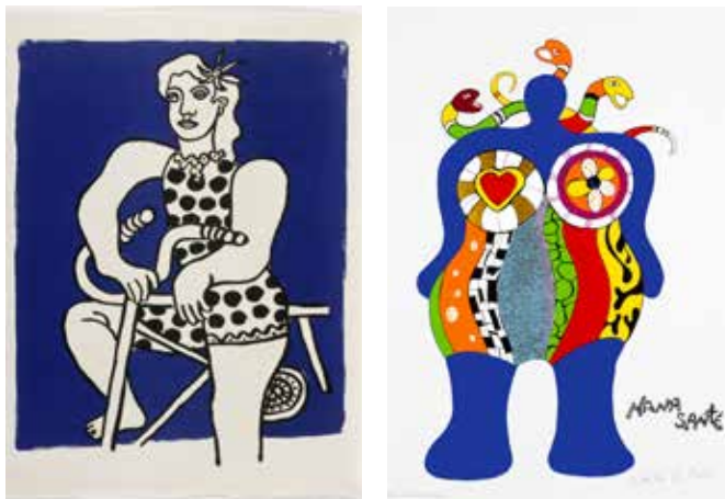
Fernand Léger, Circo , 1950, Parigi, Éditions Verve litografia, lastra da un album illustrato di 63 litografie a colori e in bianco e nero, 42 x 64 cm, Musée national Fernand Léger, Biot

Oltre ad alcune affinità tematiche o formali, esiste un legame storico tra l'arte di Fernand Léger e il Nuovo Realismo. Fervente ammiratore della sua opera, Pierre Restany avrebbe così battezzato il gruppo in onore di Léger, che utilizza questa formula già negli anni 1920 per definire il suo approccio artistico. Inoltre Fernand Léger e gli artisti di questa generazione sono accomunati dal fatto di aver rinnovato la creazione artistica riappropriandosi del mondo reale e spesso rivolgendo uno sguardo critico e politico alla società del loro tempo.