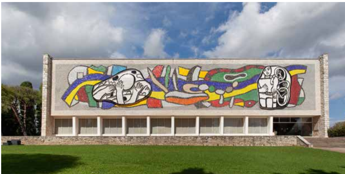
Musée national Fernand Léger, à Biot.

Le musée national Fernand Léger fait partie des musées nationaux du XX e siècle des Alpes-Maritimes qui regroupent également le musée national Marc Chagall, à Nice, et le musée national Pablo Picasso, La Guerre et la Paix , à Vallauris.