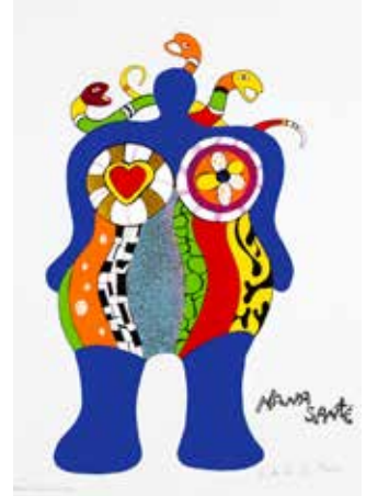
Niki de Saint Phalle, Nana santé , 1999, lithographie, 61 x 49 cm, Musée d'Art Moderne et d'Art Contemporain, Nice © 2024 Niki Charitable Art Foundation / Adagp, Paris

Dans la continuité des expositions organisées par le musée national Fernand Léger mettant en lumière les collaborations de l'artiste ou sa postérité, l'exposition Léger et les Nouveaux Réalismes , souligne la modernité visionnaire de Léger tout en rappelant les possibles sources d'inspiration de ces artistes révolutionnaires des années 1960.