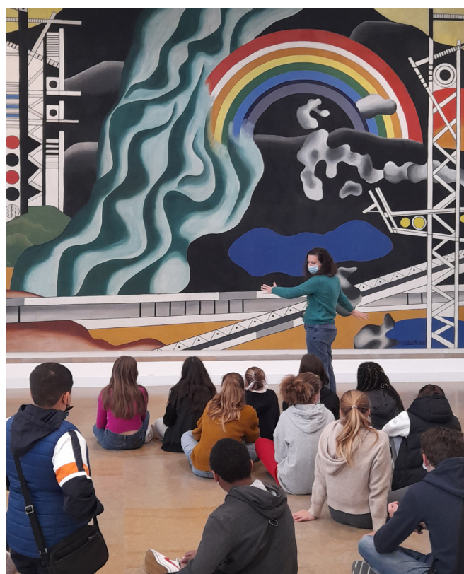
La visite devant l'œuvre de Fernand Léger Le Transport des forces , Biot. Photo © DR : musées nationaux du XX e siècle des Alpes-Maritimes © Adagp, Paris, 2024.

Un ensemble de clés est délivré tout au long de la visite pour que chaque élève puisse se constituer des repères culturels et artistiques fondés sur l'approche de l'œuvre de Fernand Léger et mieux appréhender l'histoire de l'art.