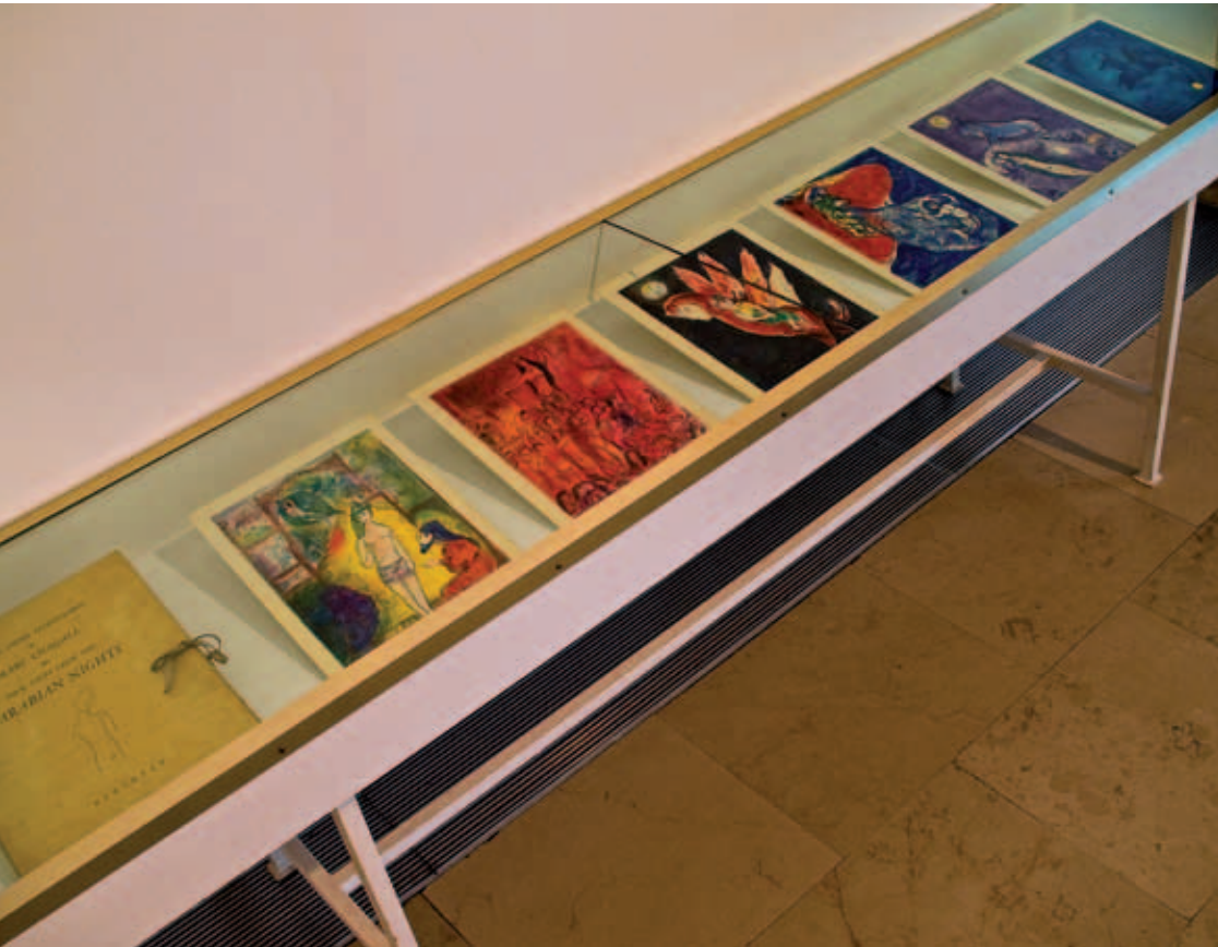
Les illustrations pour Four Tales from Arabian Nights