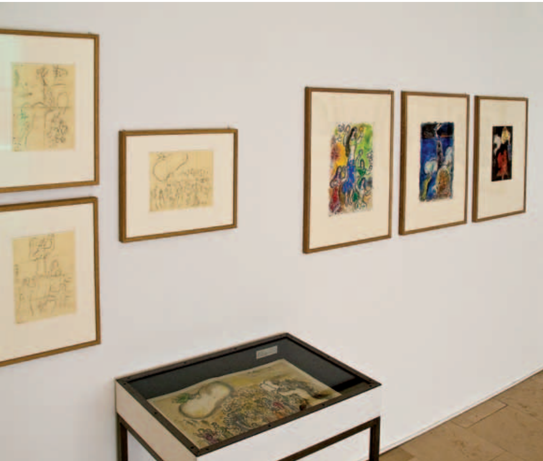
Les différentes étapes du travail pour les illustrations pour The Story of Exodus, 1966.