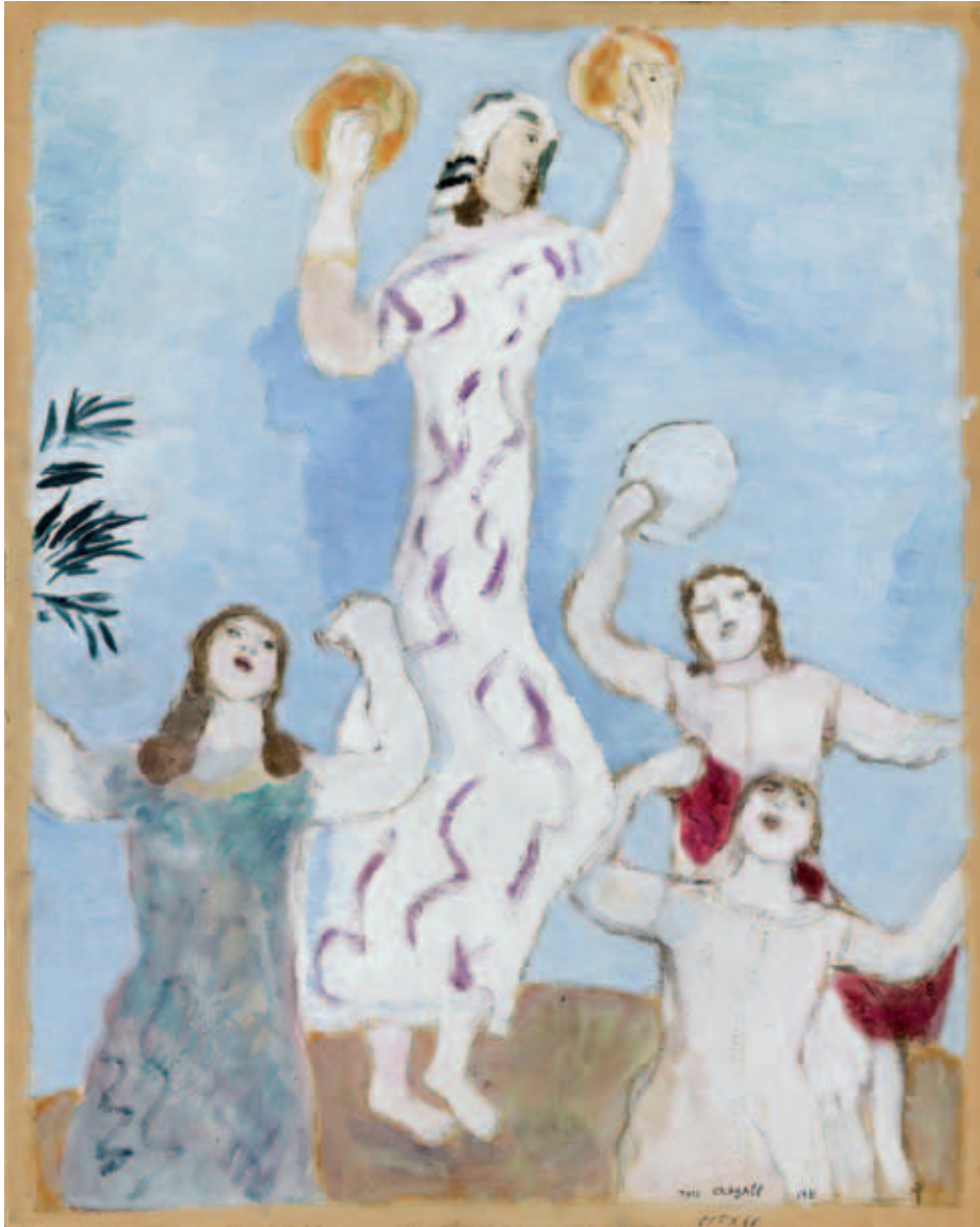
Marc Chagall, Marie danse , 1931, huile et gouache sur papier © ADAGP, Paris 2013 CHAGALL®

étranger à peine installé en France, fit scandale. Cependant, malgré les critiques largement teintées d'antisémitisme, l'exposition des gouaches faites par Chagall pour servir de modèle aux gravures, chez Bernheim jeune, connut un large succès. Les cent gouaches exposées furent toutes vendues à des particuliers. L'artiste découvre à cette occasion des textes fondamentaux de la culture française, dont sa femme lui faisait la lecture. L'introduction du paysage français, signalée par Didier Schulmann 4 , que Chagall appréhende alors au cours de ses nombreux voyages, fait aussi l'intérêt de ces œuvres. Les gravures terminées furent encore une fois remises à Vollard, qui ne publia pas plus ce livre que le précédent.