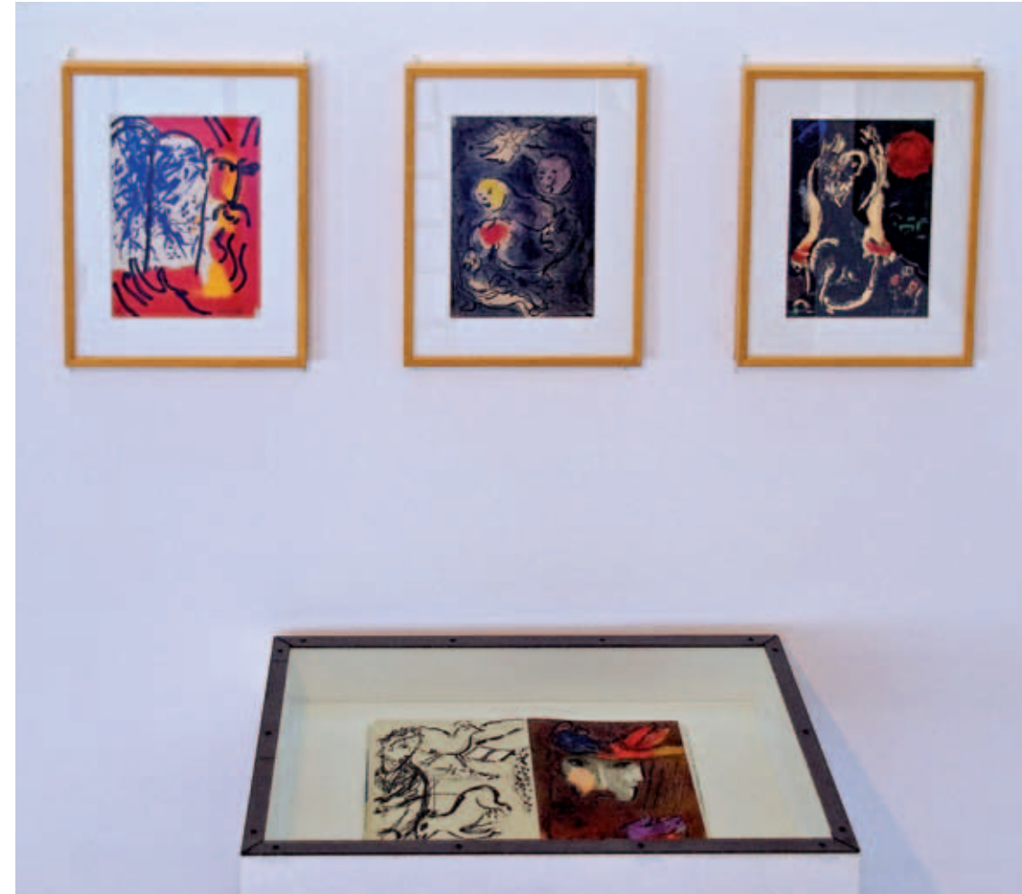
Verve n°33-34, 1956.