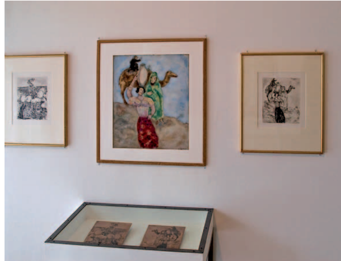
Les différentes étapes du travail pour les illustrations de la Bible