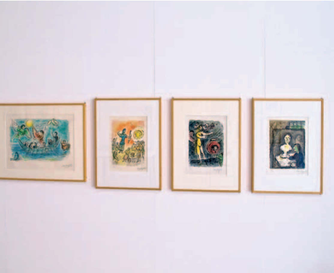
Les illustrations pour l' Odyssée , lithographies, 1974-1975.

symbolique, comme dans les œuvres bibliques, met en valeur les héros et les dieux. Il traduit avec naturel la présence de ces derniers parmi les hommes. L'inspiration puisée aux œuvres de ses prédécesseurs caractérisent aussi les illustrations pour La Tempête de Shakespeare 23 . Chagall revient, pour cette pièce, au noir et blanc, qui convient à la tension dramatique de l'œuvre. Devant l'ampleur du travail (50 illustrations), il choisit la lithographie, techniquement moins contraignante que la gravure. Il s'inspire des tableaux du XVII e siècle, en particulier des œuvres flamandes et hollandaises représentant des navires pris dans la tempête comme en ont peint Rembrandt ou Backuysen.