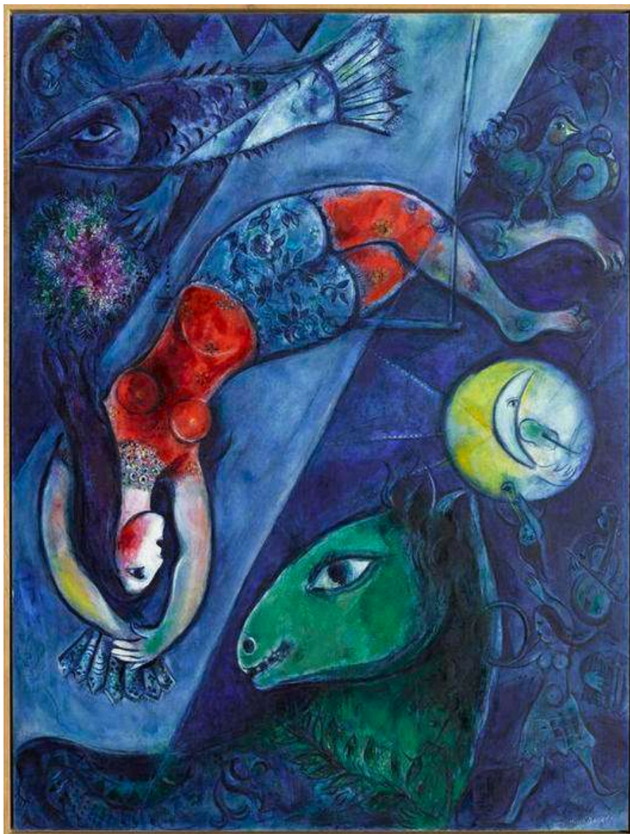
Le Cirque Bleu , 1950-52, Huile sur toile, 238x176cm, Musée national d'art moderne - Centre de Création industrielle, Centre Georges Pompidou, en dépôt au musée national Marc Chagall. © GrandPalaisRmn (musée Marc Chagall) / Gérard Blot © ADAGP, Paris, 2025