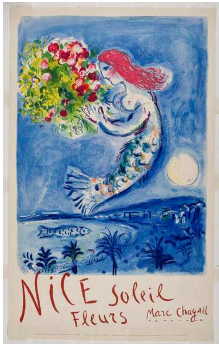
La Baie des anges (affiche), 1962. Editée par le Commissariat général au Tourisme. Lithographie exécutée par l'Atelier Fernand Mourlot, 99.5 x 61.8cm, Nice, musée national Marc Chagall.