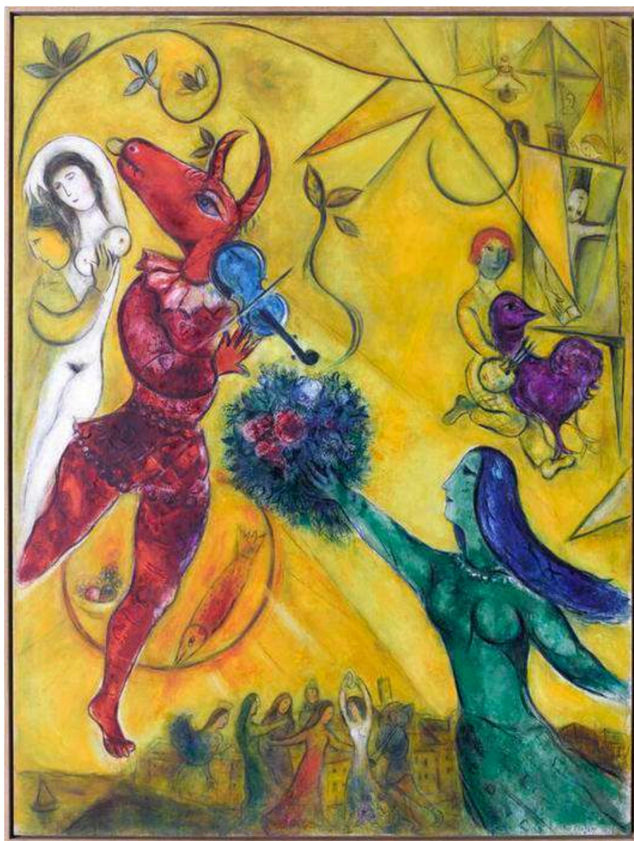
La Danse , 1950 – 1952, Huile sur toile de lin, 238 x 176 cm, Nice, musée national Marc Chagall. Dépôt du musée national d'art moderne, Paris. Dation en 1988. © GrandPalaisRmn (musée Marc Chagall) / Gérard Blot © ADAGP, Paris, 2025