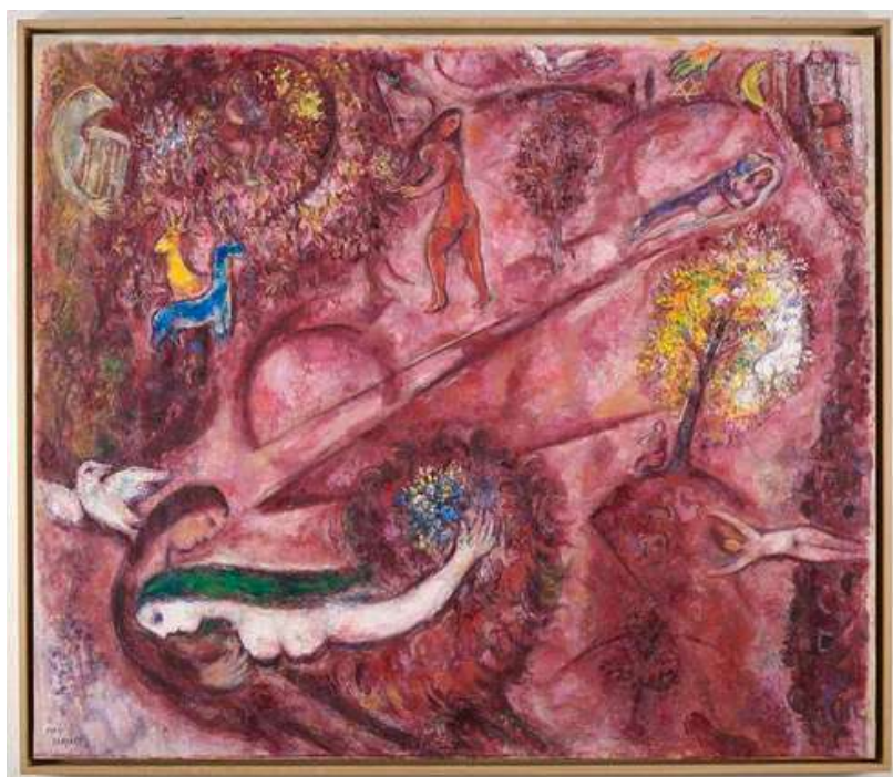
Esquisse pour Le Cantique des Cantiques I , 1960, Huile sur papier rentoilé, Nice, musée national Marc Chagall. © ADAGP, Paris