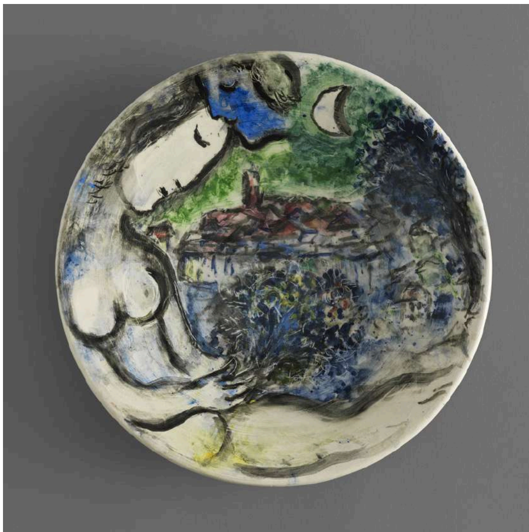
Couple au bouquet à Vence , 1958, en collaboration avec Marius Giuge, plat en terre blanche, décor aux oxydes sur émail, Collection particulière © Fabrice GOUSSET/ © ADAGP, Paris, 2025