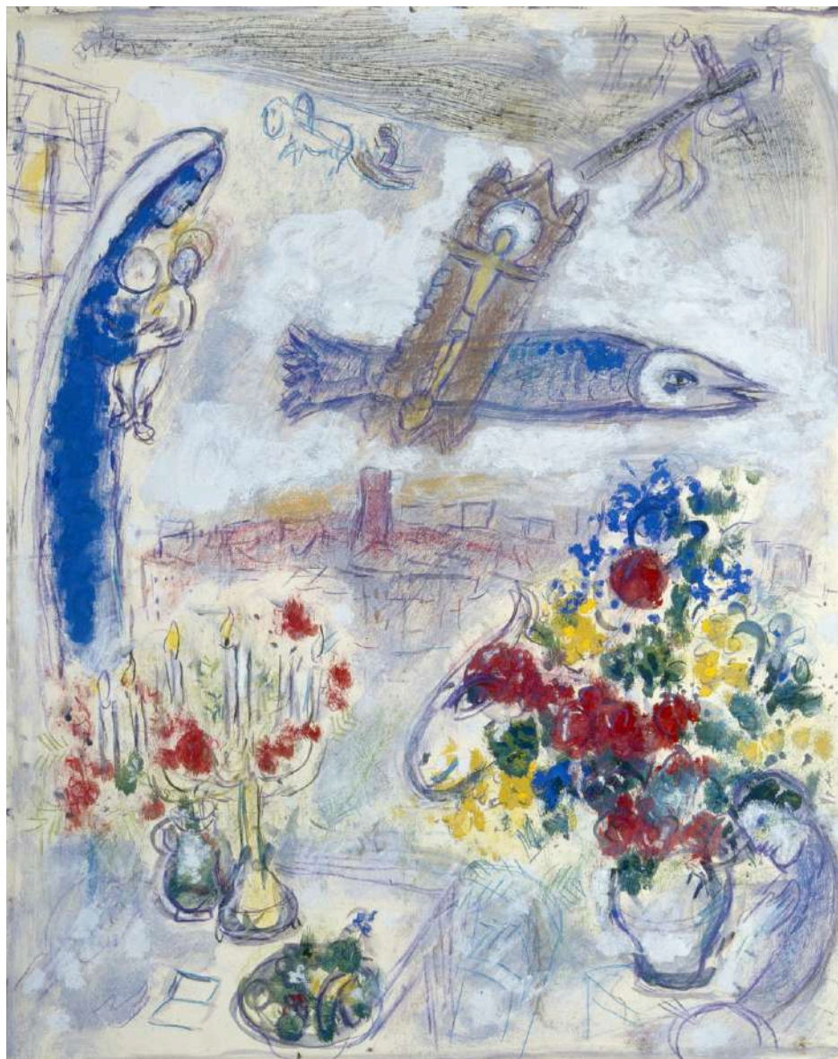
Esquisse pour Autour de Vence , circa 1957, Huile et pastel sur papier, 61 x 49 cm, Collection particulière