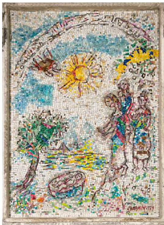
La mosaïque Moïse sauvé des eaux, 170 x 235cm, Cathédrale Notre-Dame de la Nativité de Vence. © Marc Chagall / ADAGP, Paris, 2025