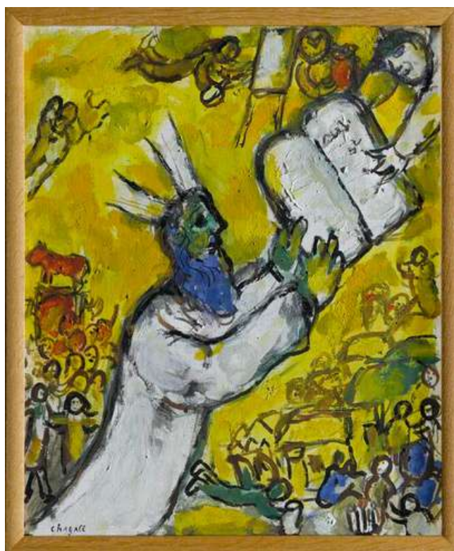
Moïse recevant les Tables de la Loi, 1960-1966, Huile sur toile, 46x 38cm, Dépôt du Centre Pompidou, Nice, musée national Marc Chagall