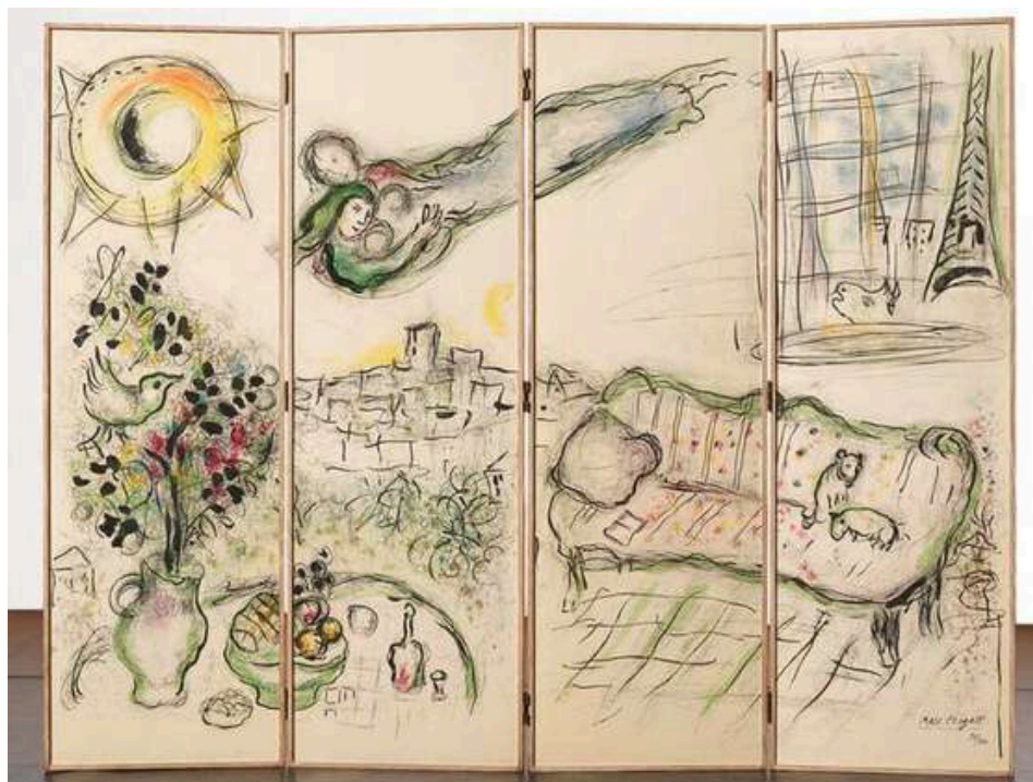
Paravent, 1963. Quatre lithographies en douze couleurs montées sur panneaux, éditions G rald Cramer. Exemplaire 39/100, achat en 2019   RMN-GP / Fran ois Fernandez   ADAGP, Paris, 2025.