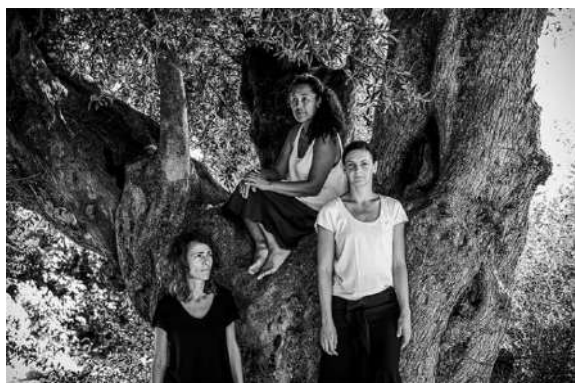
Les Glaneurs de rêve.