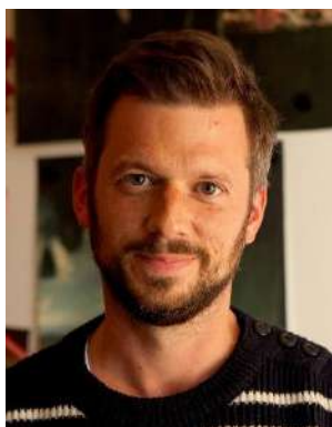
Jan Blanc.

Peintre d'histoire et portraitiste, Rembrandt van Rijn, on l'oublie souvent, s'est aussi intéressé, durant toute sa carrière, aux animaux. Ses compositions bibliques et mythologiques regorgent de bêtes domestiques (chiens, chats, chevaux, ânes, vaches, chèvres) ou d'animaux plus rares (paons, aigles, faucons). Il a aussi réalisé des études sur le vif d'animaux extra européens, comme des lions, chameaux ou éléphants, qu'il a fréquemment introduits dans ses tableaux. Ces représentations, toutefois, ne sont pas purement anecdotiques. Comme le montrent sa Fillette aux deux paons (v. 1639, Amsterdam, Rijksmuseum) ou son Bœuf écorché (1655, Paris, Louvre), Rembrandt a interrogé de façon critique les rapports que les animaux non humains entretiennent avec les animaux humains, et avec lui-même. Dans le sillage de ces constats, et dans le cadre d'une réflexion plus large sur la place de l'animal dans la culture néerlandaise du XVII e siècle, cette conférence propose de jeter une lumière nouvelle sur l'œuvre de Rembrandt, en tentant de comprendre le regard que le peintre hollandais a jeté sur des êtres auxquels il accordait une importance cruciale.