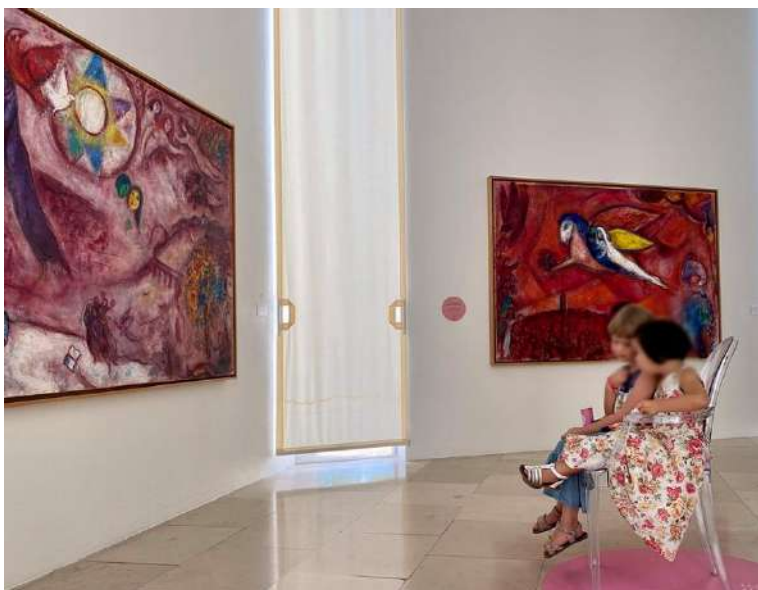
Enfants assis dans la salle du Cantique des Cantiques , au musée national Marc Chagall, testant les parfums de Jean-Claude Ellena, expérience olfactive proposée à l'occasion de l'exposition Chagall et moi ! Regards contemporains sur Marc Chagall .

Journées européennes du Patrimoine Journée Portes Ouvertes en famille Mars aux musées Nuit européenne des Musées – La Classe L'œuvre